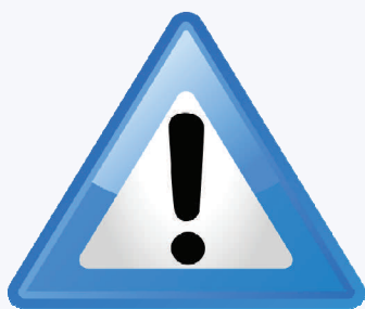
Знак дорожного движения

Профессиональное вождение — самая частая и самая опасная ошибка, которую совершают любители. «Ридерз дайджест»