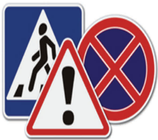
Знаки дорожного движения